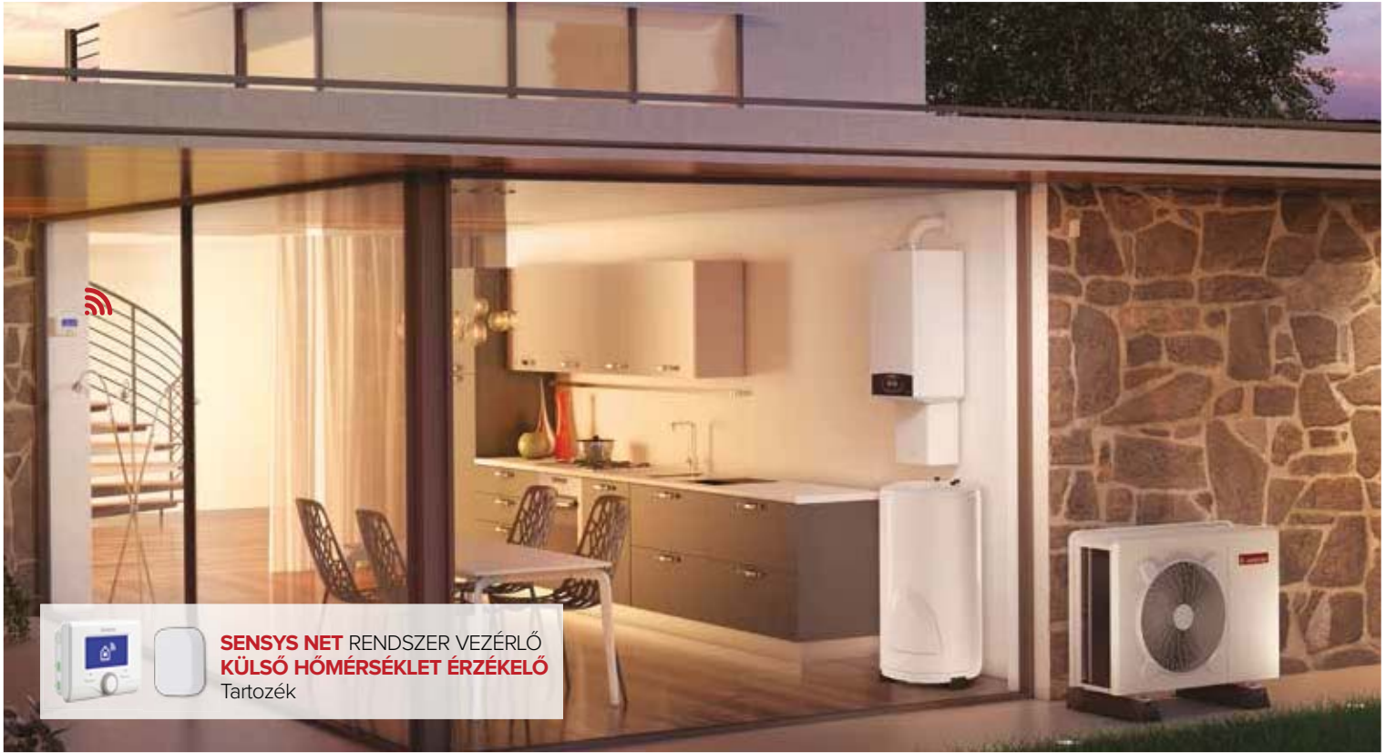
SENSYS NET RENDSZER VEZÉRLŐ KÜLSŐ HŐMÉRSÉKLET ÉRZÉKELŐ Tartozék